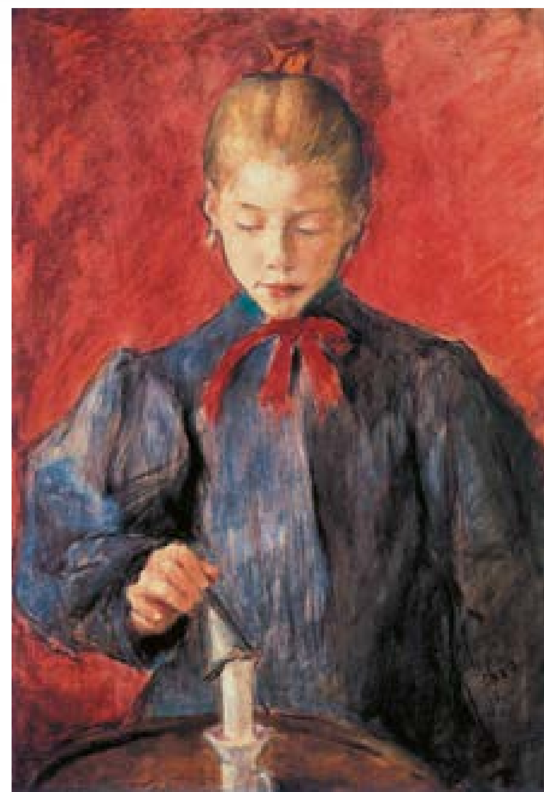
Stanisław Wyspiański, Dziewczynka gasząca świecę

Portret – obraz przedstawiający osobę lub grupę osób z zachowaniem podobieństwa, także podobizna lub wizerunek