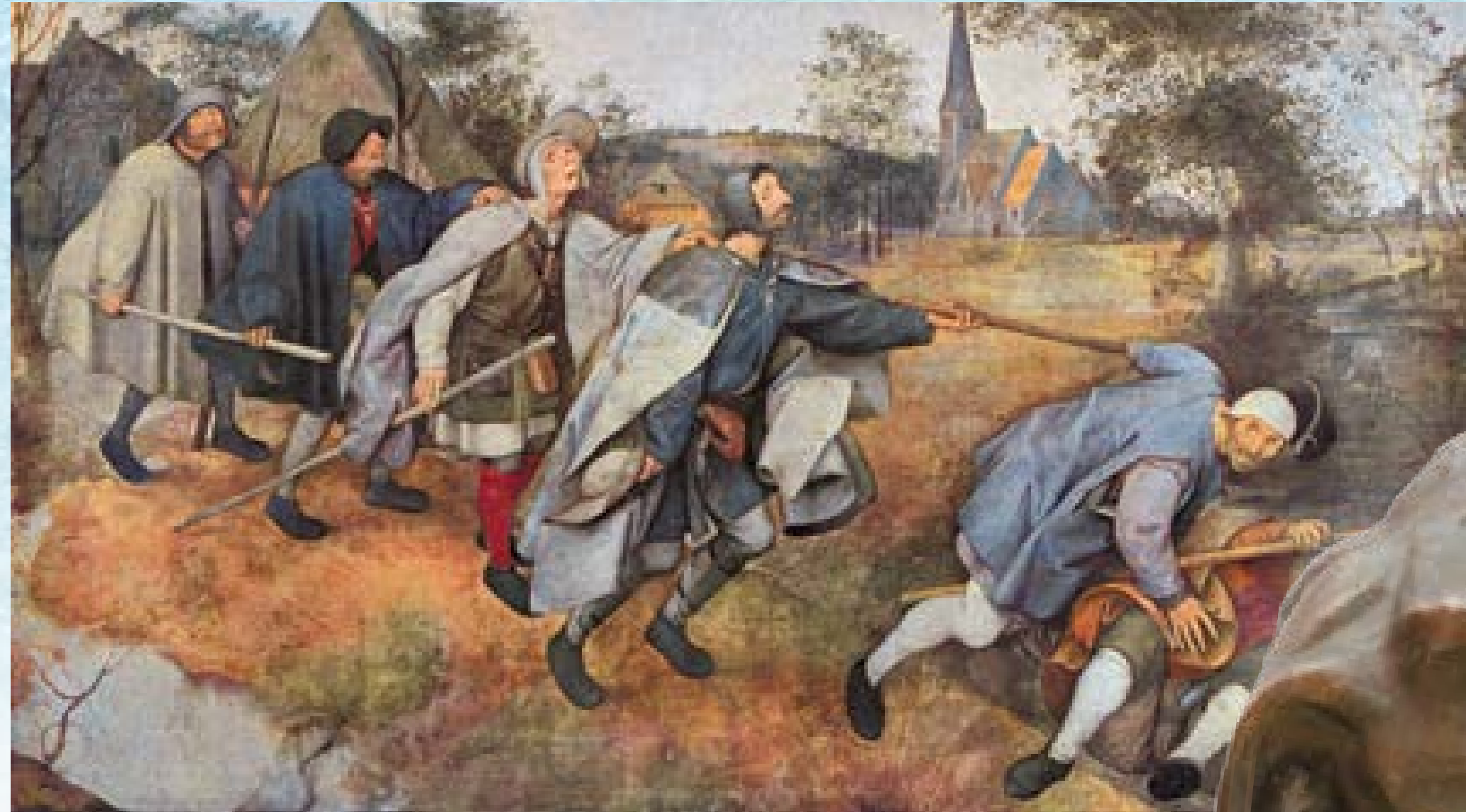
Pieter Bruegel, Ślepcy

Scena rodzajowa – obraz przedstawiający scenę z życia codziennego