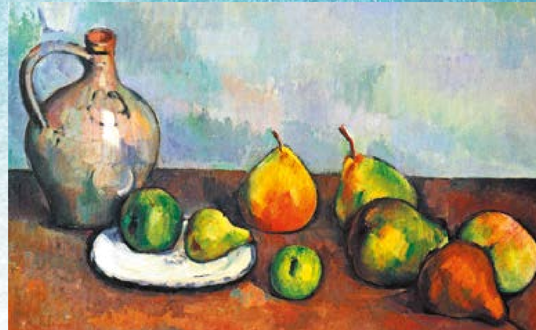
Paul Cézanne, Martwa natura

Scena rodzajowa – obraz przedstawiający scenę z życia codziennego