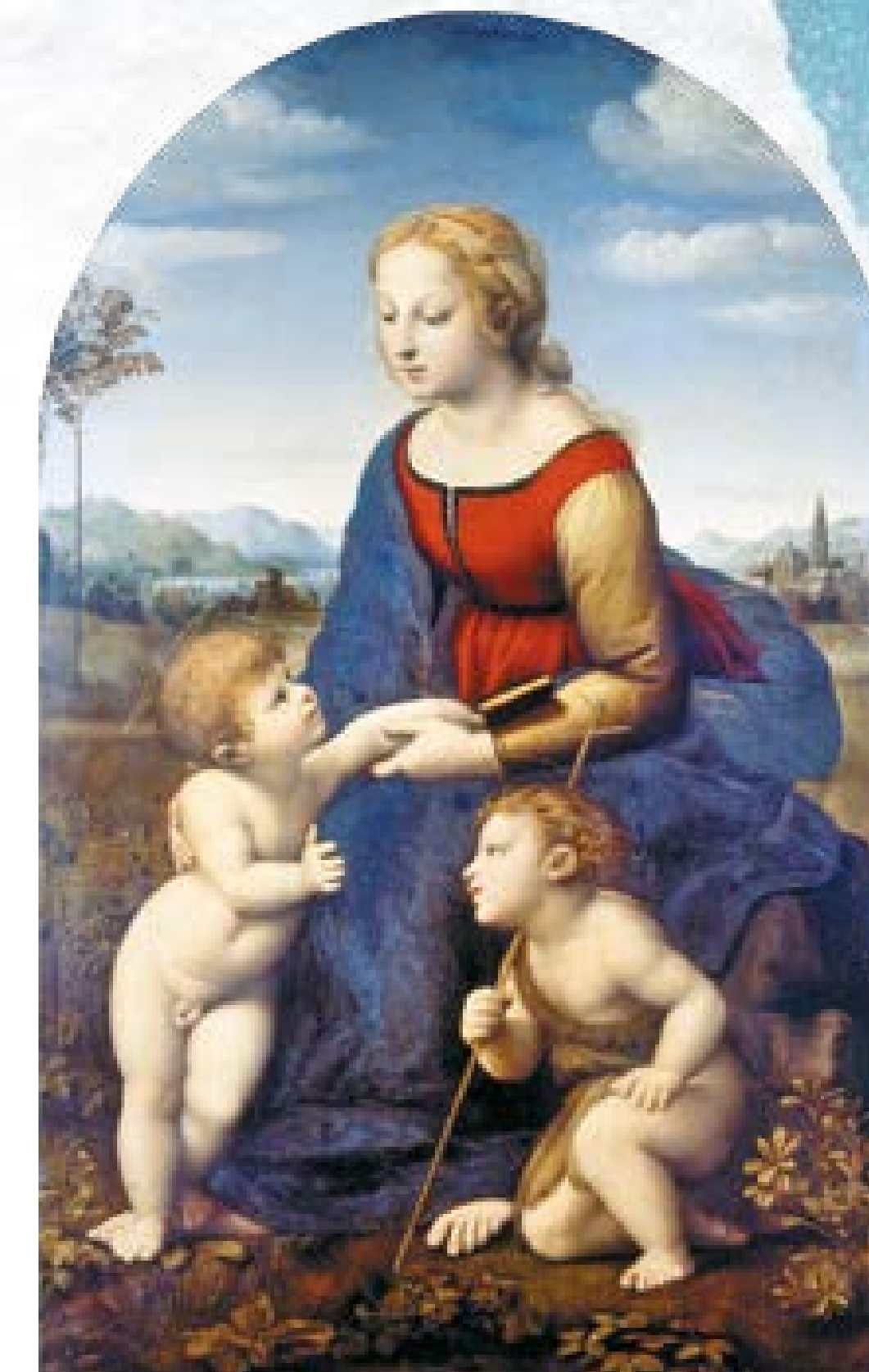
Rafał, Madonna z dziećmi (Piękna Ogrodniczka)

Portret – obraz przedstawiający osobę lub grupę osób z zachowaniem podobieństwa, także podobizna lub wizerunek