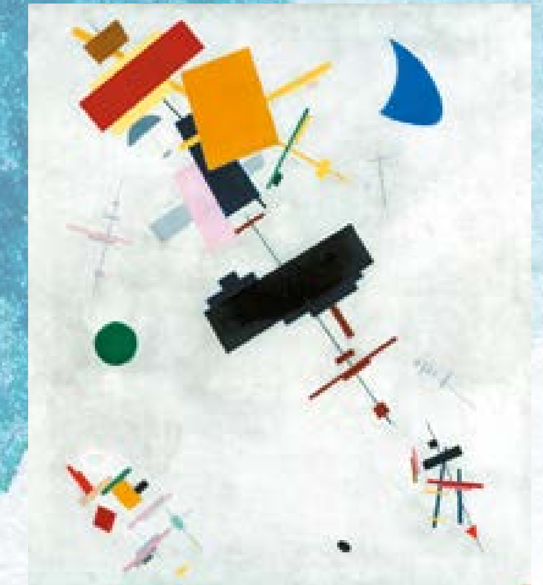
Kazimierz Malewicz, Kompozycja suprematyczna

Martwa natura – wyobrażenie przedmiotów nieożywionych, np. owoców, kwiatów, naczyń, instrumentów muzycznych, ryb czy broni, ułożonych w przemyślaną kompozycję