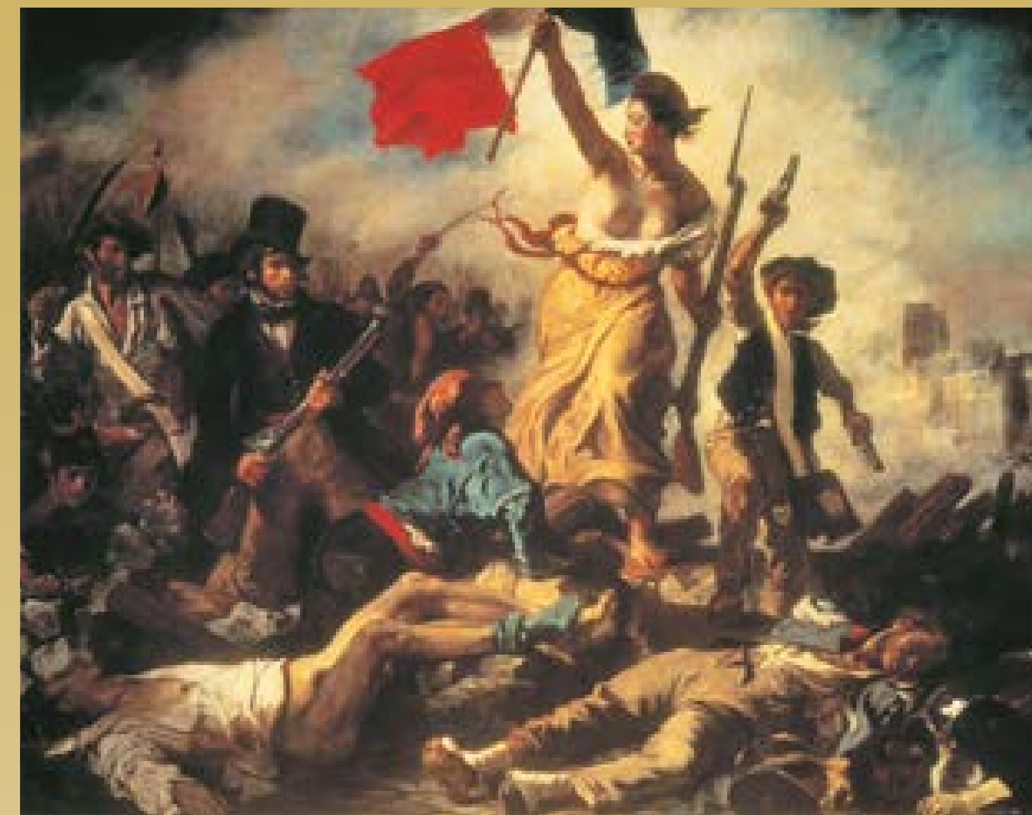
Eugène Delacroix, Wolność wiodąca lud na barykady, 1830

W sztukach plastycznych romantyzm sprzymierzył się z ideą postępu, walk narodowowyzwoleńczych i dążeń do propagowania ideałów równości i demokracji. Zwrócił się też ku artystycznej przeszłości, również starożytnej i średniowiecznej.