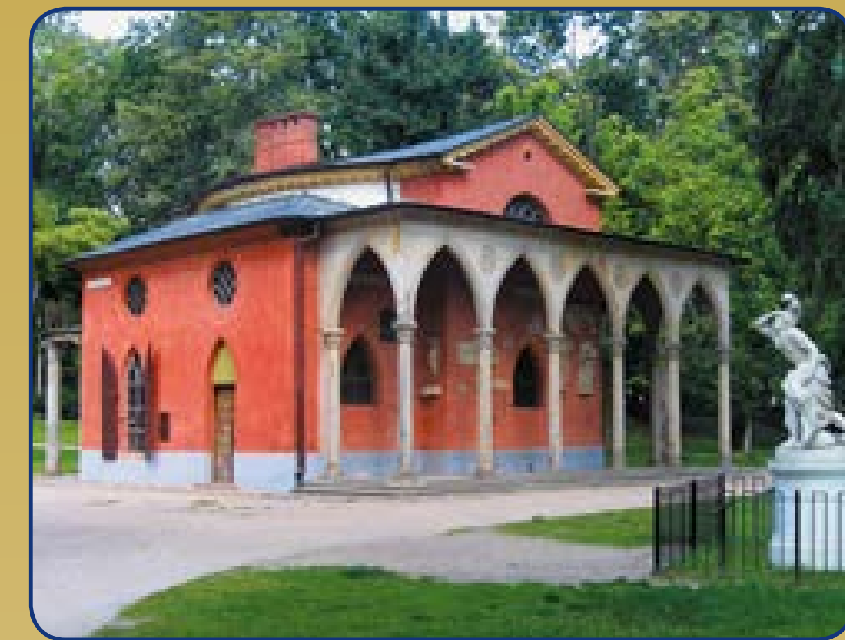
Piotr Aigner, Domek Gotycki w Puławach, 1801–1809