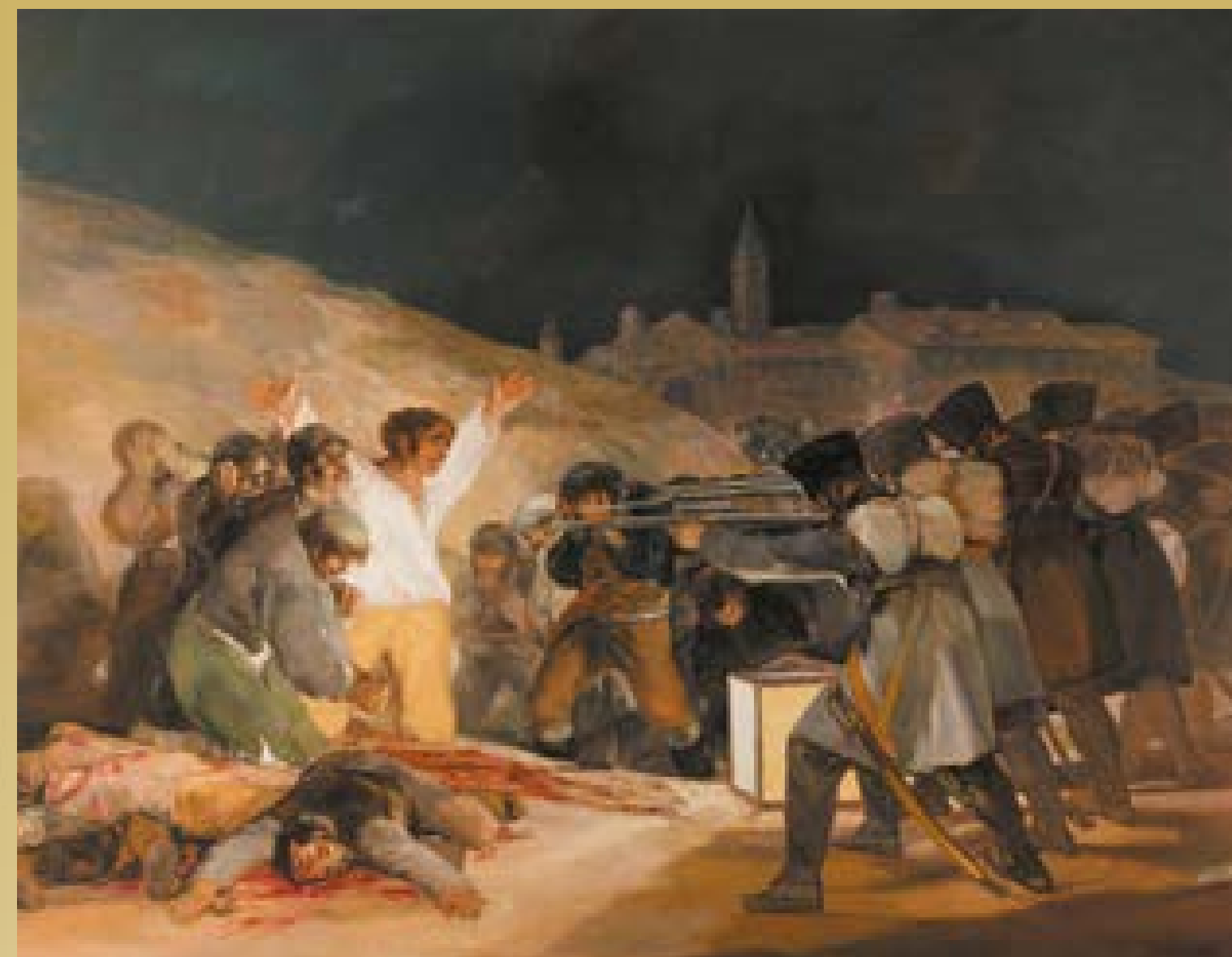
Francisco Goya, Rozstrzelanie powstańców madryckich 3 maja 1808 roku, 1814