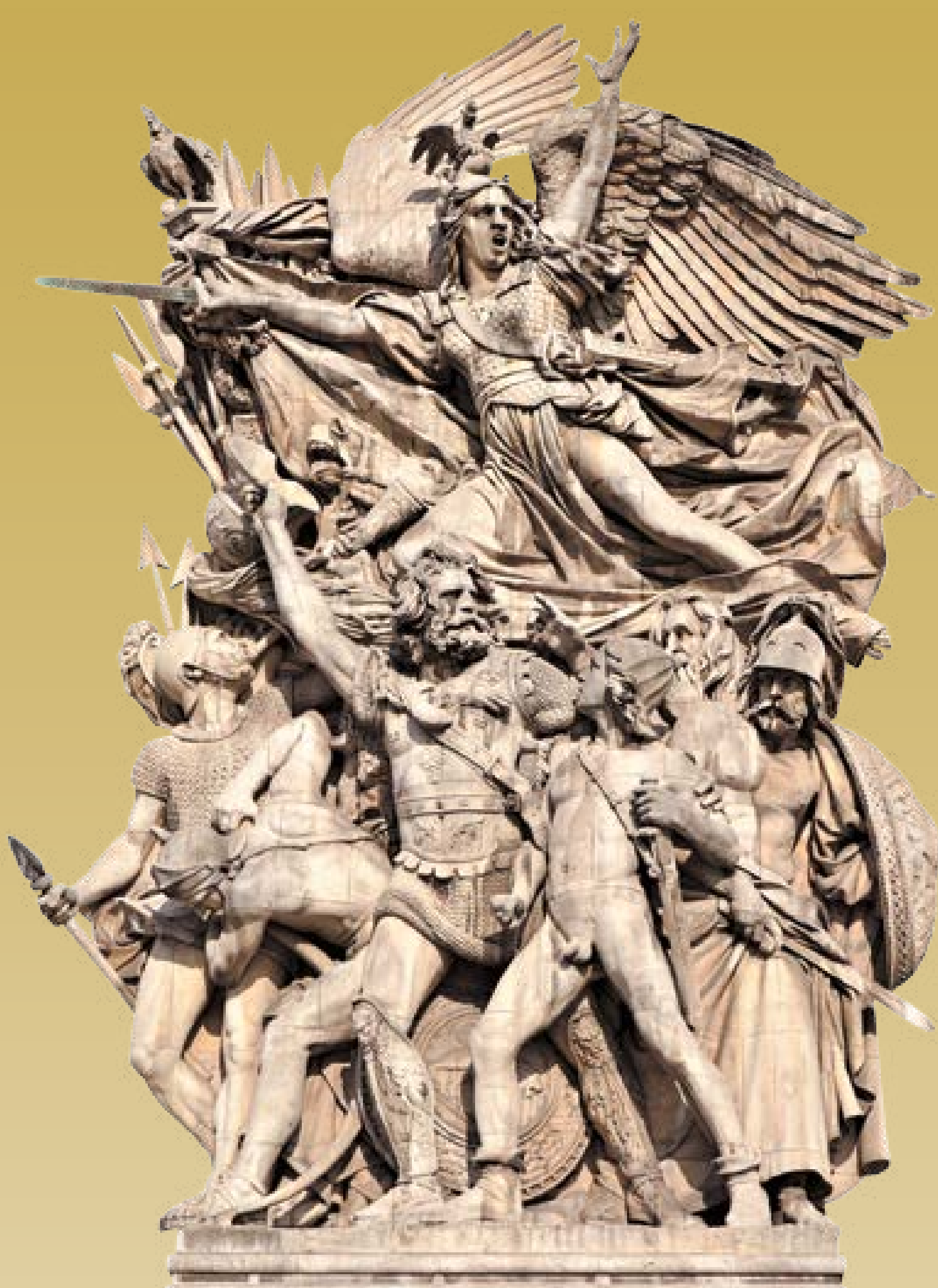
François Rude, Marsylianka (Wymarsz ochotników w 1792 roku), 1833

Początki romantyzmu sięgają rewolucji francuskiej. W 1. połowie XIX wieku romantyzm często zarówno łączył się, jak i polemizował z klasycyzmem.