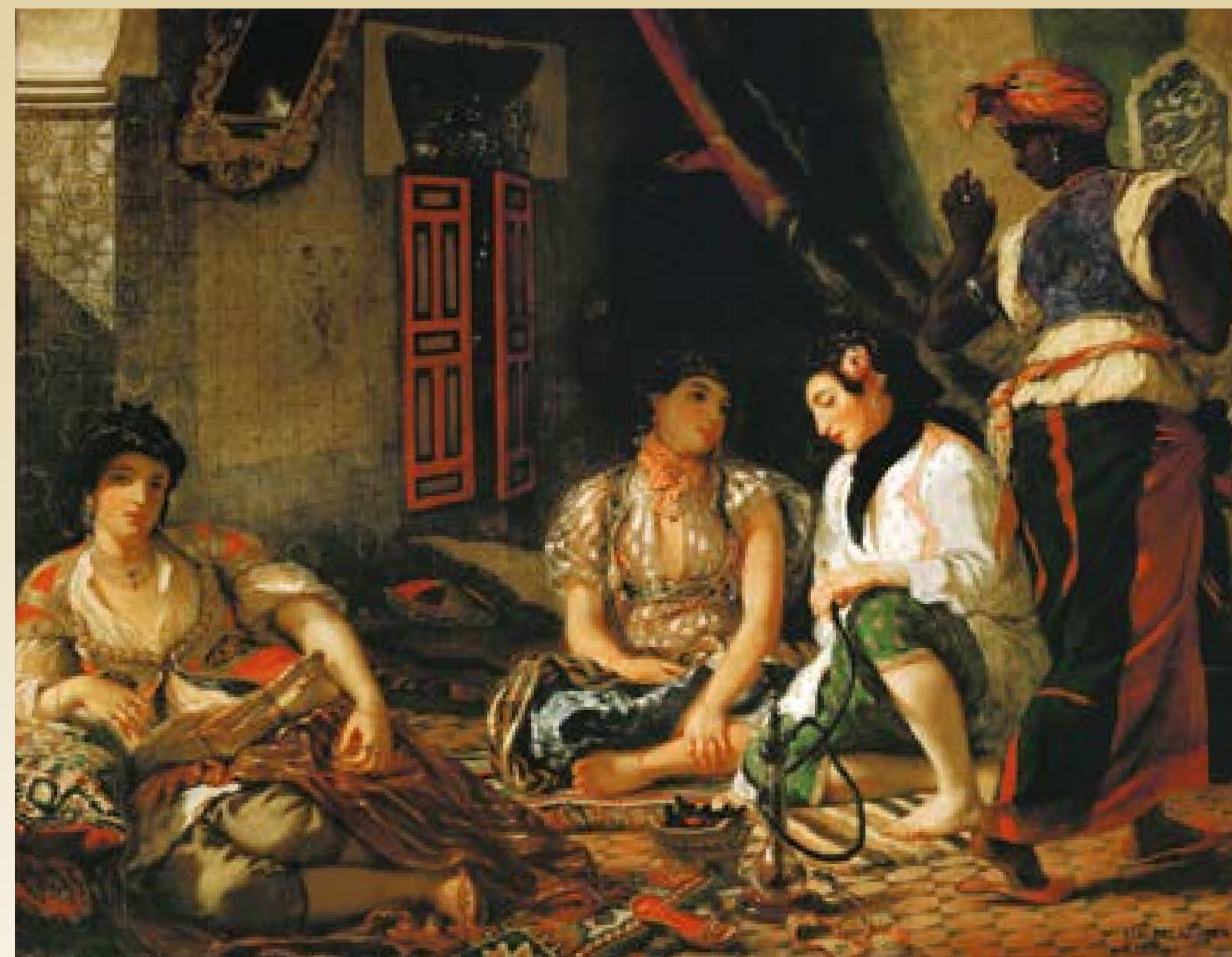
Eugène Delacroix, Kobiety algierskie, 1834

W sztukach plastycznych romantyzm sprzymierzył się z ideą postępu, walk narodowowyzwoleńczych i dążeń do propagowania ideałów równości i demokracji. Zwrócił się też ku artystycznej przeszłości, również starożytnej i średniowiecznej.