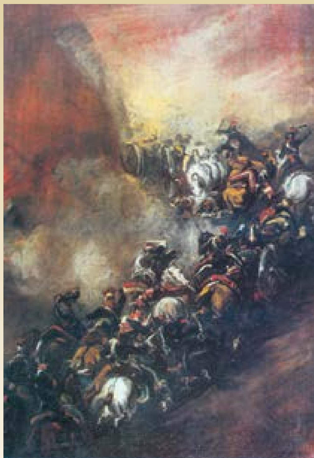
Piotr Michałowski, Bitwa pod Somosierrą, ok. 1837

Malarstwo romantyczne jest – podobnie jak barokowe – pełne dynamiki i uczuciowości, kontrastów kolorystycznych i światłocieniowych.